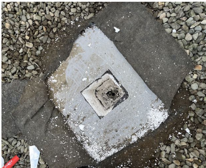
Fotodokumentace z provedené sondy